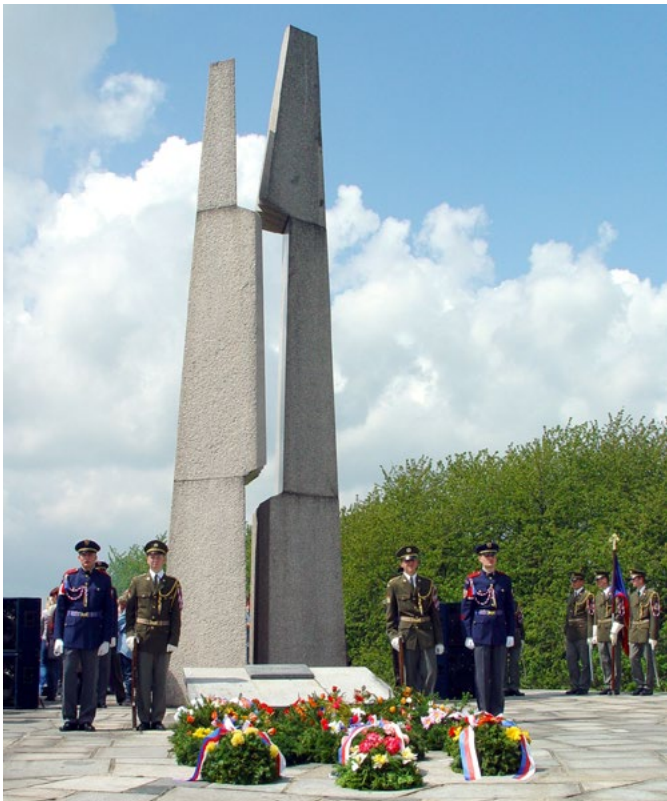
Poslední výstřely druhé světové války v Evropě padly ve středních Čechách, mezi obcemi Slivice a Milín 11. května 1945