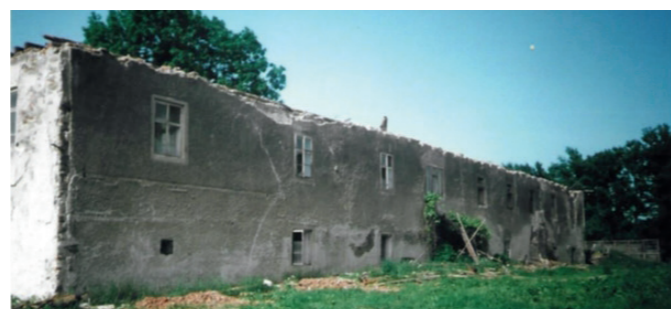
↑ bourání zámečku č. p. 67 ↓ zámek ve statku